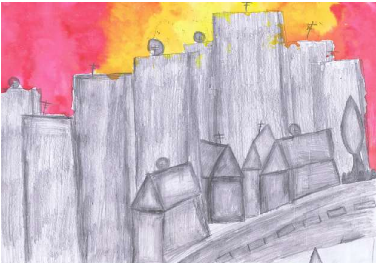
Obr. č. 10