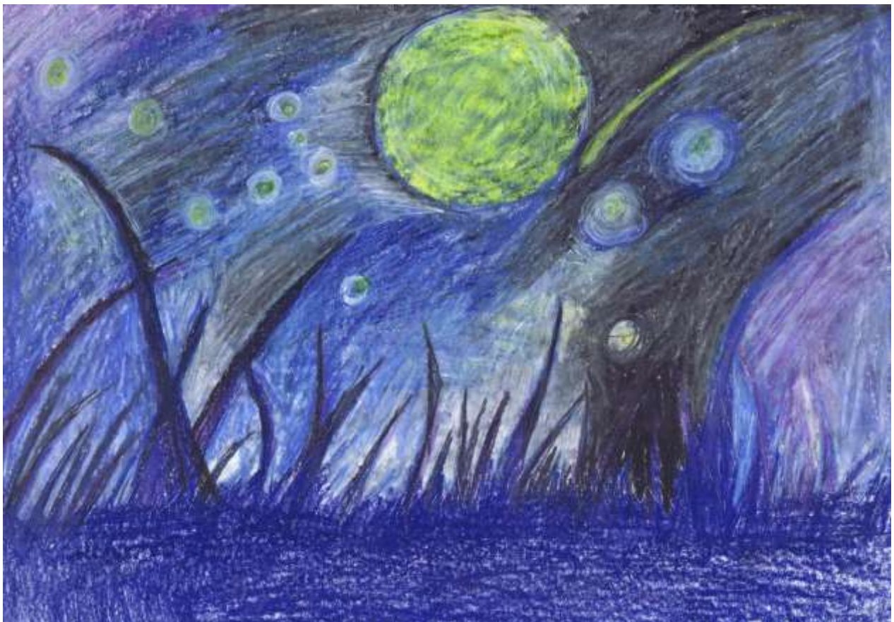
Obr. č. 7