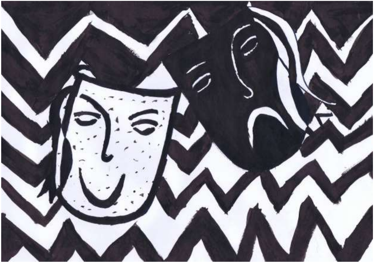
Obr. č. 12