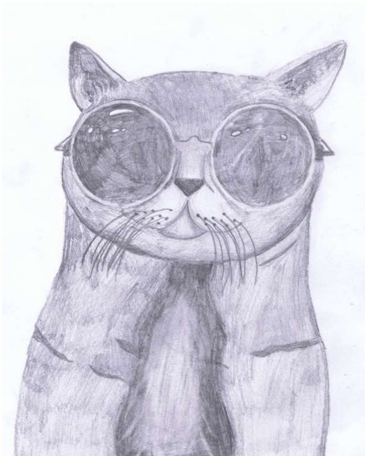
Obr. č. 11