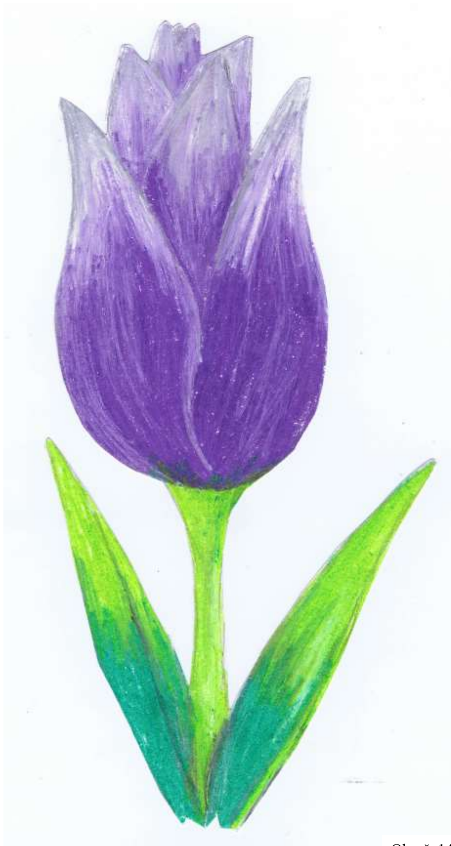
Obr. č. 14